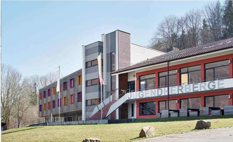
Jugendherberge Bad Urach